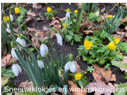
Sneeuwkllokjes en winterakonieten

Terwijl sneeuwkllokjes en winterakonieten volop stonden te bloeien, mochten we er afgelopen week